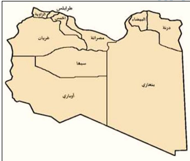
شكل (1): التقسيم الإداري لمخططات الجيل الأول (1963-1969)

مجلة دراسات الإنسان والمجتمع Human and Community Studies Journal